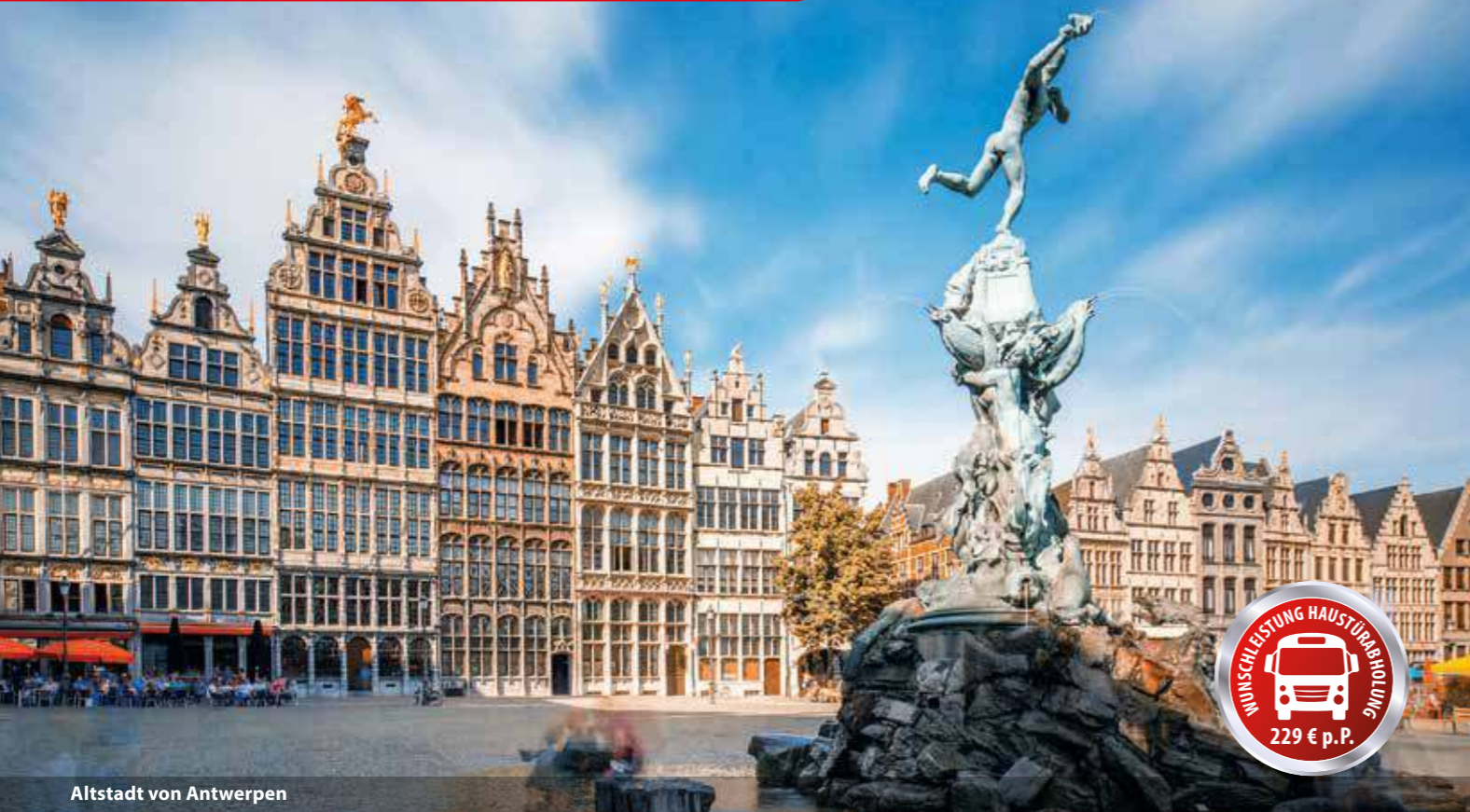
Altstadt von Antwerpen