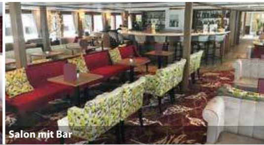
Salon mit Bar