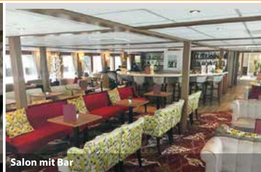
Salon mit Bar