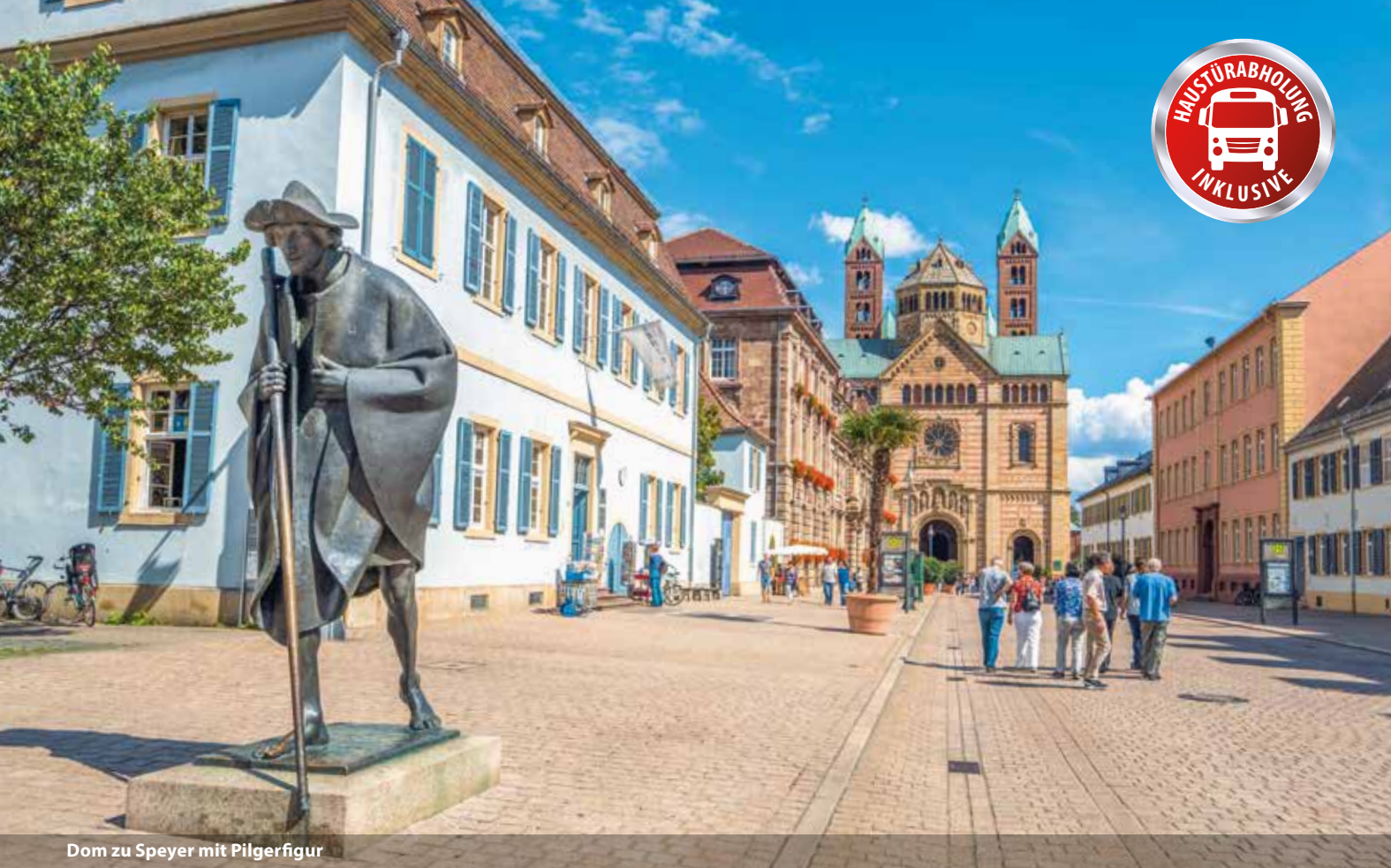
Dom zu Speyer mit Pilgerfigur