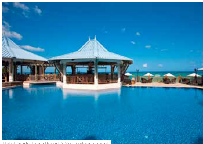
Hotel Pearle Beach Resort & Spa, Swimmingpool