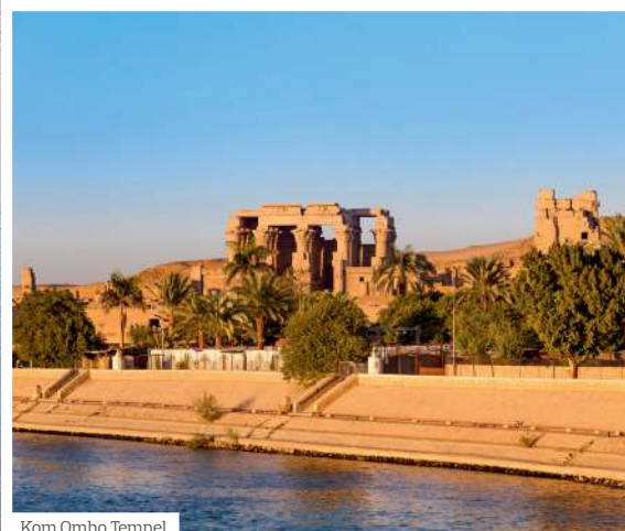
Kom Ombo Tempel

Ägypten ist das älteste Kulturland der Erde. Es gibt keine bessere Alternative dieses Land zu entdecken, als durch eine Nilkreuzfahrt. Erholen Sie sich an Bord, während Ihr Hotelschiff langsam auf dem Nil dahin gleitet. Vorbei an steinernen Kulturdenkmälern, die wie eine Perlenkette entlang seiner Ufer aufgereiht sind, von Palmenhainen, Moscheen und Minaretten. Erleben Sie faszinierende Sonnenuntergänge und genießen Sie die Freundlichkeit der Ägypter. Im Anschluss an die Kreuzfahrt können Sie sich an den Traumstränden von Hurghada erholen.