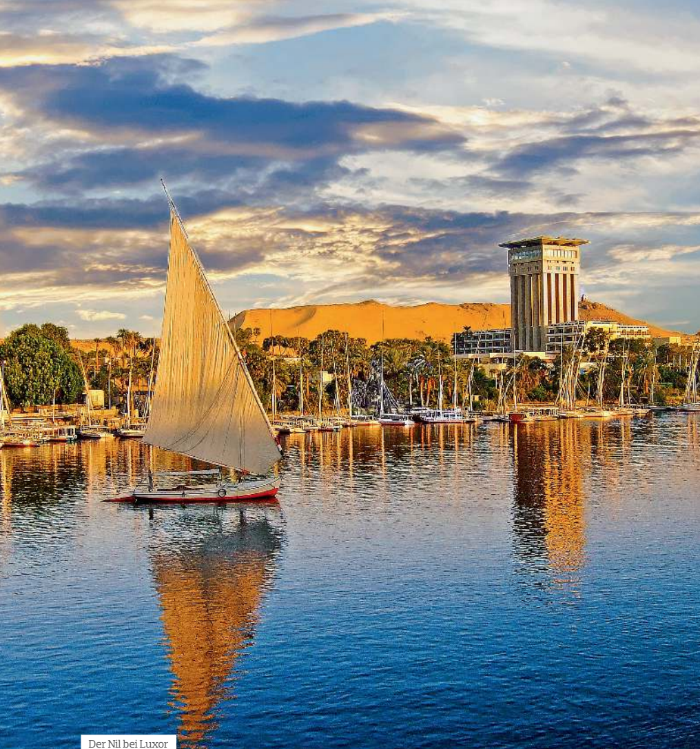
Der Nil bei Luxor