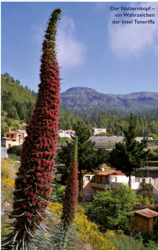
Der Natternkopf – ein Wahrzeichen der Insel Teneriffa