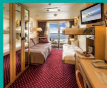
2-Bett-Junior-Suite, Balkon, Lido-Deck (Kat. T+)