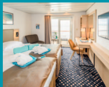
2-Bett, Superior, Balkon, Salon-/Apollo-Deck (Kat. P, Q, Q1)