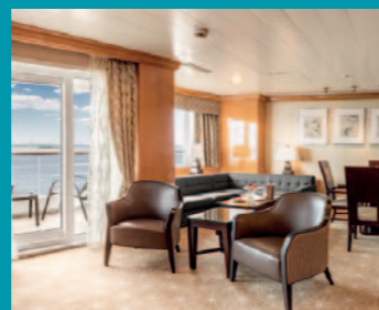
2-Bett, Royal-Suite, Balkon, Panorama-Deck (Kat. W)