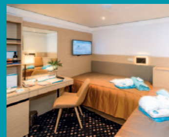
2-Bett, innen, diverse Decks (Kat. D, E, G)