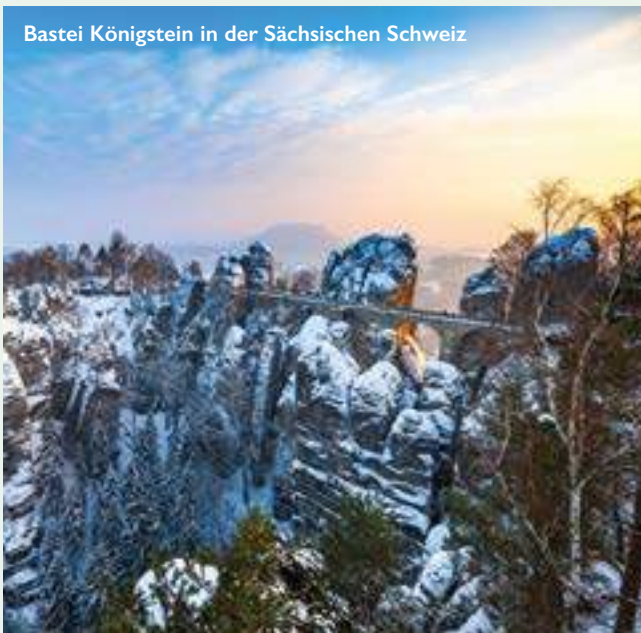
Bastei Königstein in der Sächsischen Schweiz

* Vorteilspreis: Der Vorteilspreis gilt für ein limitiertes Kontingent. Fragen Sie nach diesem Preis und Ihrer Wunschkabine.