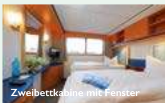
Zweibettkabine mit Fenster