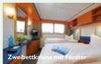
Zweibettkabine mit Fenster