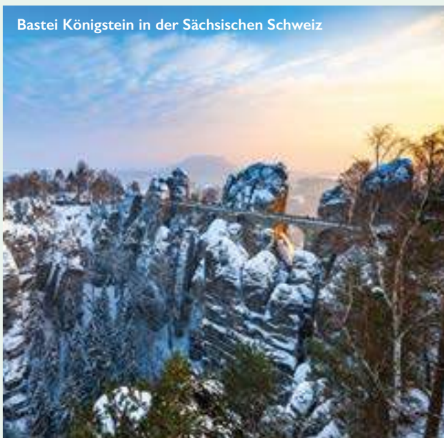
Bastei Königstein in der Sächsischen Schweiz