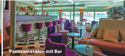
Panoramasalon mit Bar