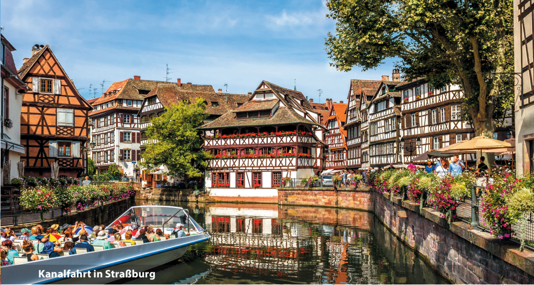
Kanalfahrt in Straßburg