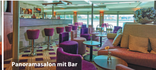
Panoramasalon mit Bar