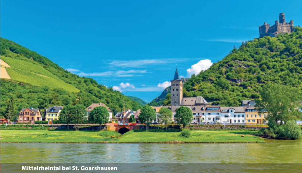
Mittelrheintal bei St. Goarshausen