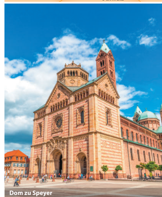
Dom zu Speyer