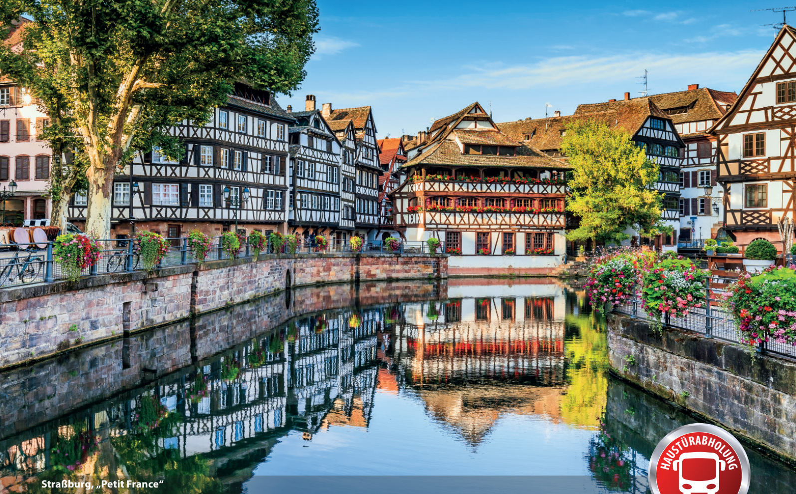
Straßburg, „Petit France“