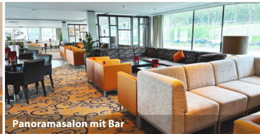
Panoramasalon mit Bar