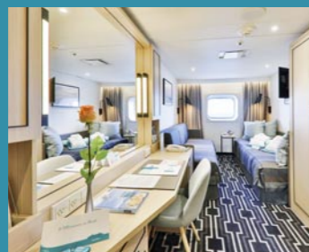
2-Bett außen, Saturn-Deck (Kat. K, L), Orion-Deck (Kat. M)