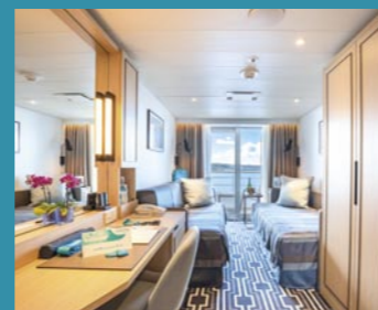
2-Bett-Superior, Balkon, Promenaden-/Lido-/Jupiter-Deck (Kat. O+, P, R)