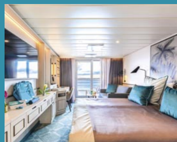
2-Bett-Junior-Suite, Balkon, Panorama-Deck (Kat. T)