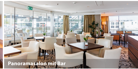
Panoramalounge mit Bar