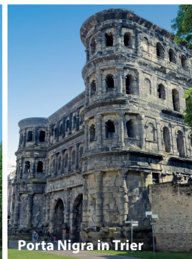
Porta Nigra in Trier