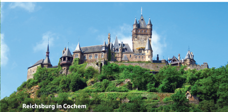
Reichsburg in Cochem