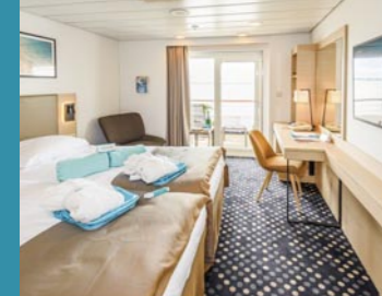
2-Bett, Superior, Balkon, Salon-/Apollo-Deck (Kat. P, Q, Q1)