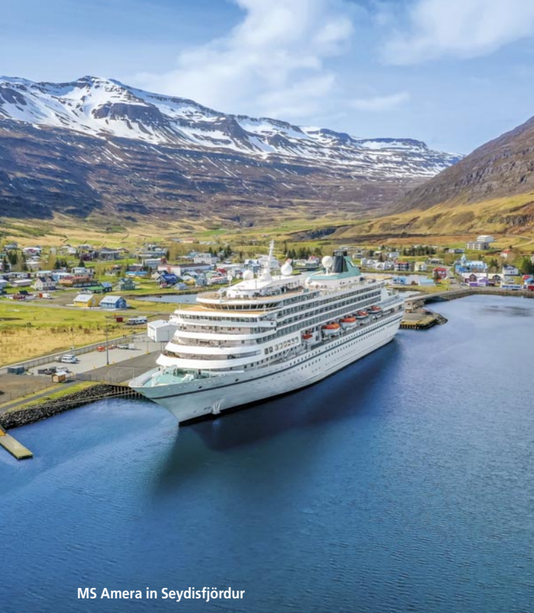
MS Amera in Seydisfjörður