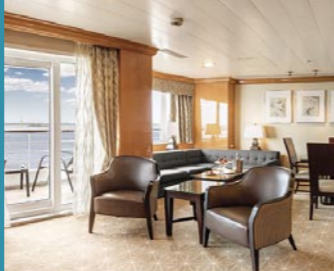
2-Bett, Royal-Suite, Balkon, Panorama-Deck (Kat. W)