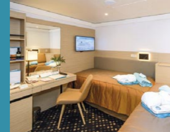
2-Bett, innen, Saturn-, Promenaden-, Apollo-Deck (Kat. D, E, G)