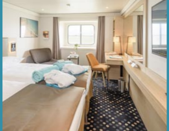
2-Bett, außen, diverse Decks (Kat. I, K, L, M, N, O)