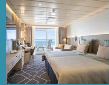
2-Bett-Junior-Suite, Balkon, Jupiter-/Lido-Deck (Kat. S, T)