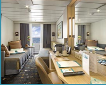
2-Bett-Superior, Balkon, Orion-/Apollo-/Jupiter-Deck (Kat. PG, P, Q, R, Q1)