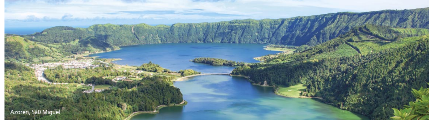
Azoren, São Miguel