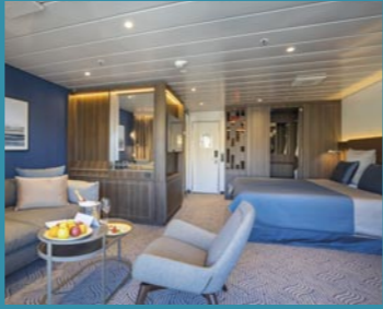
2-Bett-Suite, Balkon, Lido-Deck (Kat. V)