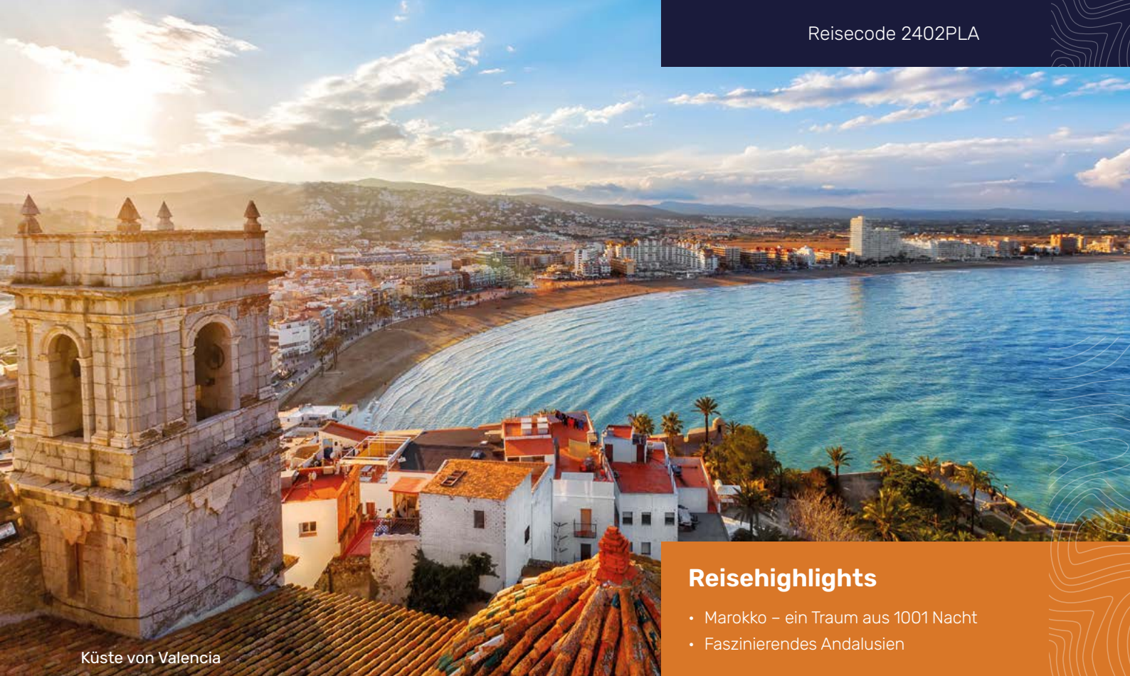
Küste von Valencia